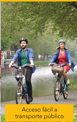
Acceso fácil a transporte público