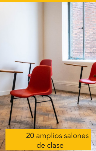
20 amplios salones de clase

Ubicado en un hermoso edificio emblemático en el centro de la ciudad, ELI Dublin se encuentra a pocos pasos de las principales áreas comerciales, culturales y de entretenimiento. Nuestra gran escuela cuenta con 20 aulas luminosas y espaciaosas, una estación de café y salones para estudiantes con juegos y áreas de estudio. Ofrecemos una variedad de programas de idioma inglés de alta calidad y servicios auxiliares que incluyen alojamiento, traslados y recorridos para adultos y adolescentes durante todo el año.