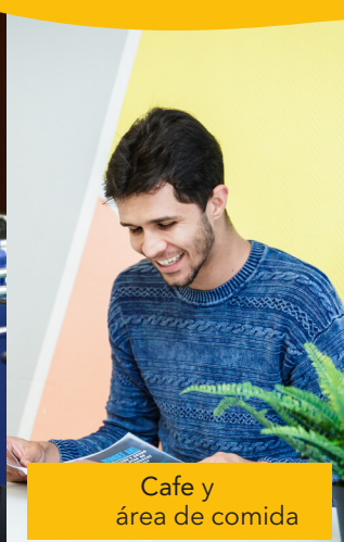
Cafe y área de comida